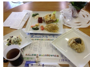
右記は前回(1/25)の写真です。