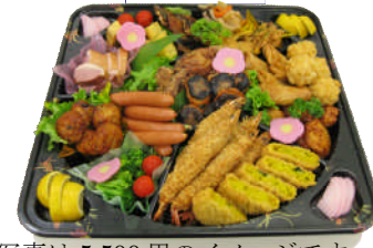
写真は5,500円のイメージです