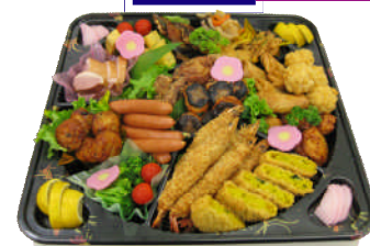
写真は5,500円のイメージです