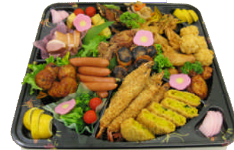
写真は5,500円のイメージです